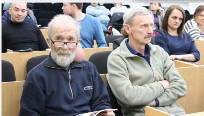
Сход граждан и ПЭК