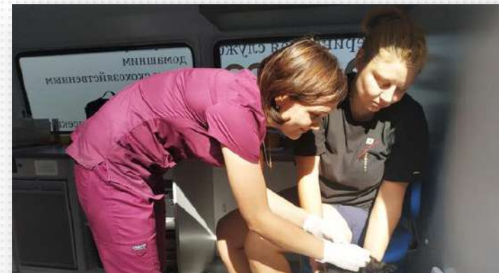
Вакцинация в СНТ