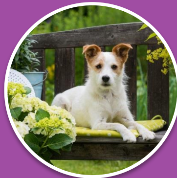
«Трубников Бор» и «Дунай»