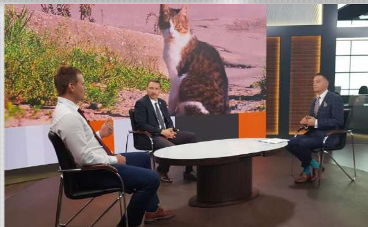
СМИ и сайт