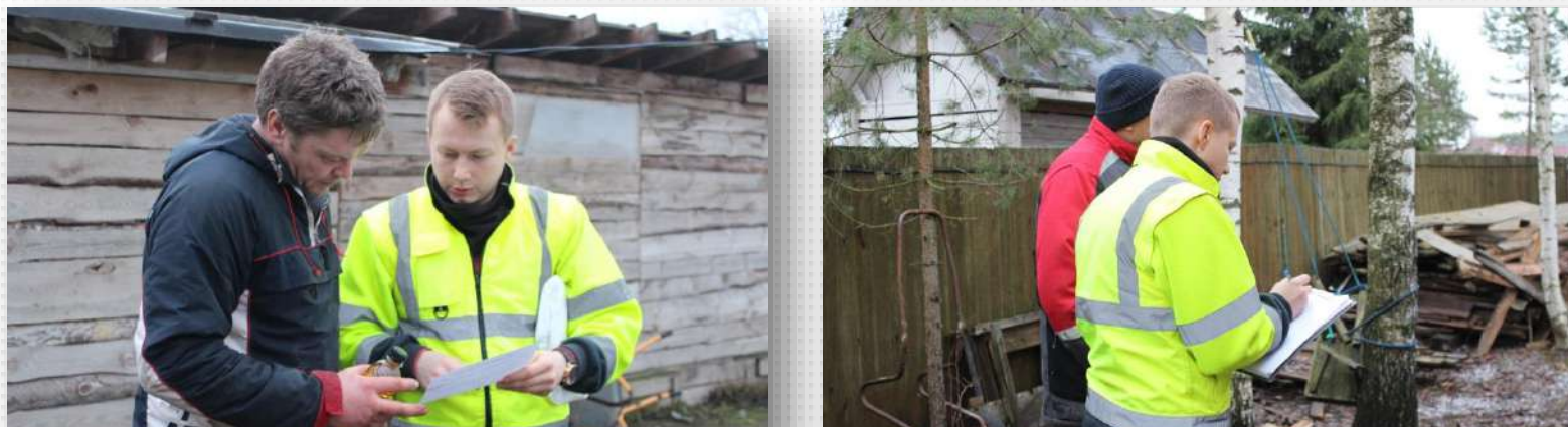
Беседы с владельцами